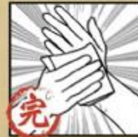
清水沖淨 並擦乾雙手