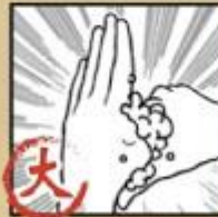
搓揉大拇指 及虎口