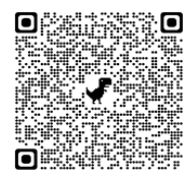
國立臺北藝術大學-生活輔導組 (臉書粉絲專頁)

本組已配合電子看板及學校官網輪播，並分送各系所海報文宣公告周知，相關訊息亦透過生輔組官網、臉書與 EDM 通知，敬請老師及同學加入「國立臺北藝術大學-生輔組」臉書粉絲專頁追蹤並按「讚」，生輔組每週更新資訊，即可隨時獲取兵役相關資訊。